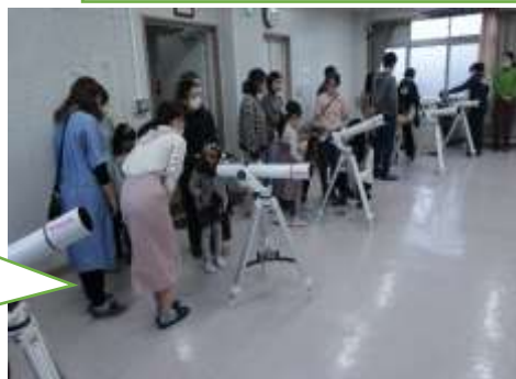
グループごとに 望遠鏡操作