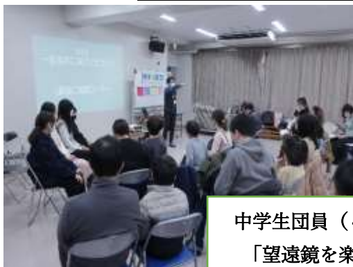
中学生団員 (4人) も参加 「望遠鏡を楽しもう！」