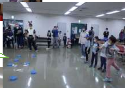
クリスマス プレゼント