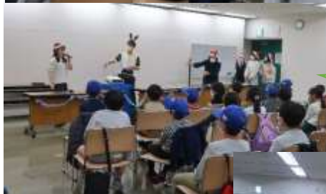
飛行機飛ばしゲーム (まど：高得点)